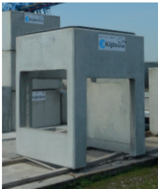
Hondehokput ten behoeve van aansluiting op bestaand riool.

Naast de min of meer standaard inspectieputten produceert kijlstra ook op bestelling speciale putten.