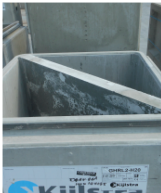
Put met een overstortdrempel.