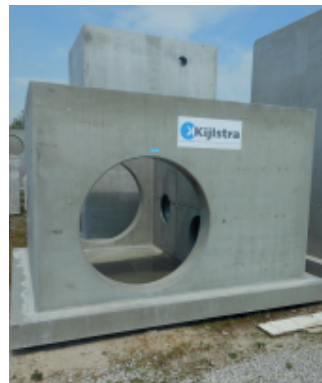
Varioput met een overstortdrempel.